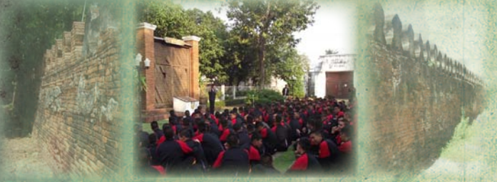
กำแพงและประตูเมืองโบราณราชบุรี พ.ศ.๒๓๖๐ (ร.ศ.๓๖)

ศาลเจ้าพ่อหลักเมืองราชบุรี เมื่อ พ.ศ. ๒๔๖๘ หลักเมืองแห่งเดียวใน ประเทศไทยที่ตั้งอยู่ในค่ายทหาร